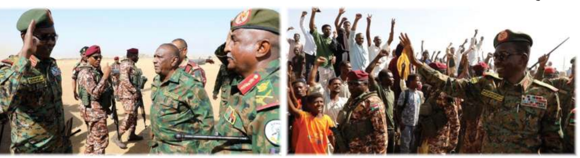
تفقد المقاتلين في الخطوط الامامية

مروي- الكرامة وصل رئيس مجلس السيادة الانتقالي القائد العام للقوات المسلحة الفريق أول ركن عبدالفتاح البرهان، أمس للولاية الشمالية ضمن جولته الولائية للفرق والوحدات. وكان في استقباله بمطار مروي اللواء الركن سليمان كمال حاج الخضر قائد الفرقة 19 مشاة بمروي حيث تدافع مواطنو مدينة مروي لاستقباله. وحيا البرهان جموع المواطنين الذين خرجوا لاستقباله بمدينة مروي، وتفقد ضباط وضباط صف وجنود الفرقة 19 مشاة بمروي وتلقى تنويراً حول مجمل الأوضاع الأمنية بالولاية.